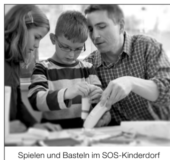
Spielen und Basteln im SOS-Kinderdorf

SOS-Kinderdorf unterhält bundesweit zahlreiche stationäre Angebote, vor allem in den 17 SOS-Kinderdörfern mit 98 Kinderdorffamilien und rund 503 Plätzen . Andere stationäre Unterbringungsmöglichkeiten bei SOS-Kinderdorf sind Wohngruppen oder Erziehungsstellen.