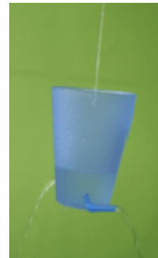
Becher mit Wasser gefüllt