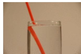
Der Strohhalm schräg im Glas