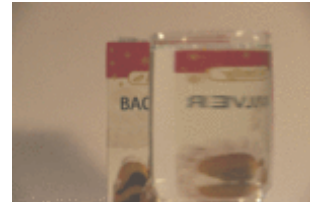
Schrift hinter dem Glas