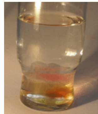
Die Gummibärchen nach einer Nacht im Wasser