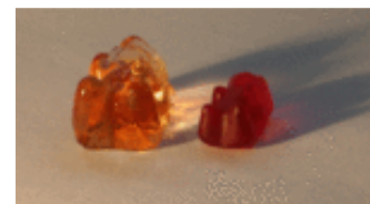
Größenvergleich: Welches lag wohl im Wasser?