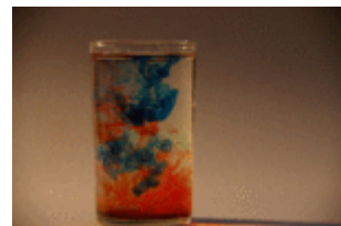
Schönheit nur für den Moment