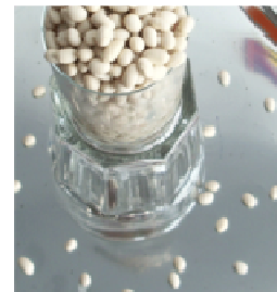
Nach einer Weile gibt es laute Töne.