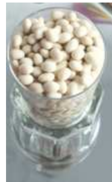
Das Glas auf ein Blech stellen.