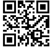
Foto direkt bearbeiten

Die Funktion ein Foto direkt zu bearbeiten dürfte den meisten bekannt sein. iPadOS bietet eine sehr umfangreiche und komfortable Möglichkeit die eigenen Fotos zuzuschneiden, optisch zu verändern oder mit Annotationen zu versehen.