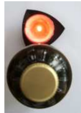
Weinflasche und Kerze von oben gesehen