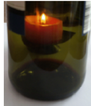
Weinflasche und Kerze von vorn gesehen