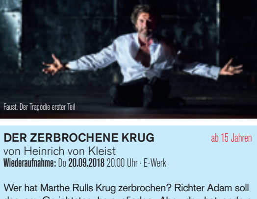
Faust. Der Tragödie erster Teil

Die Suche nach dem Unbedingten in einer bedingten Welt – das ist das Leitmotiv des »Faust«, Prototyp des »modernen Individuums« und Menschheitstragödie, die zugleich DAS Stück der Deutschen ist.