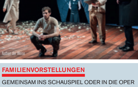
Nathan der Weise

Lessing entwirft mit seinem Ideendrama ein Sinnbild des respektvollen Umgangs der Religionen untereinander. Die Lektüre heute zwingt uns die Gültigkeit der Lessingschen Idee von Toleranz neu zu prüfen. Haben wir als Weltgemeinschaft die Kraft ein empathisches Miteinander zu gestalten?