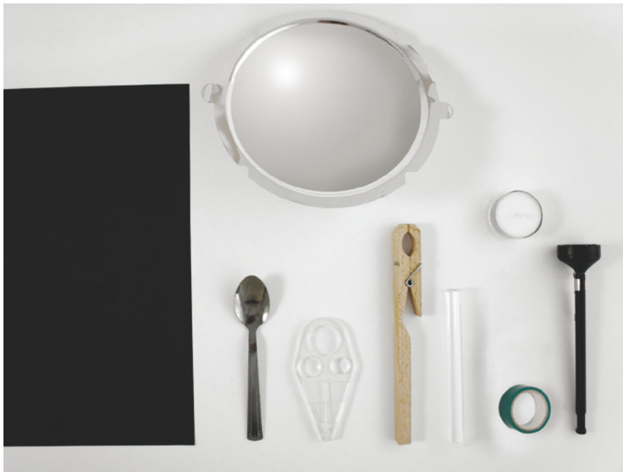
Abb. 3: Mitgelieferte Geräte bzw. Materialien für eine Schülergruppe.