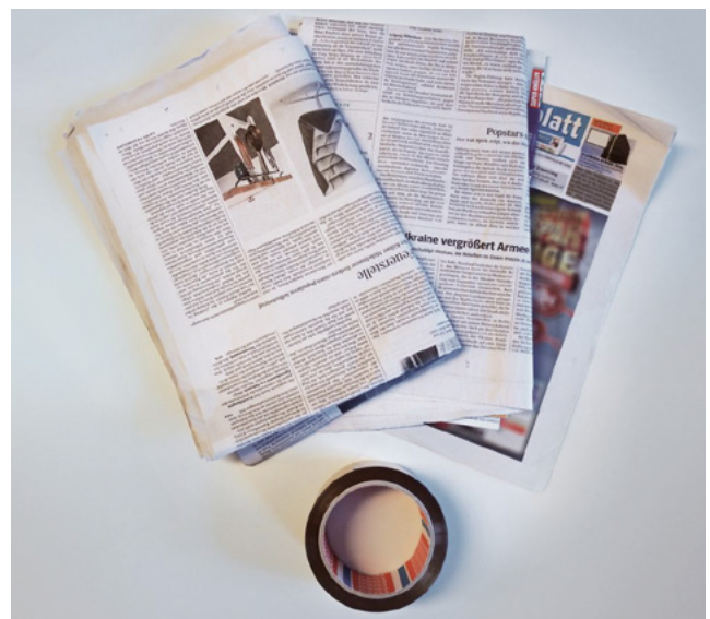
Abbildung 2: Benötigte Materialien.