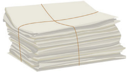
Abbildung 1: Ein Stapel Altpapier.

Ein vielseitig wiederverwendbarer Altstoff ist zum Beispiel Papier. Was könnte man aus Altpapier alles zaubern?