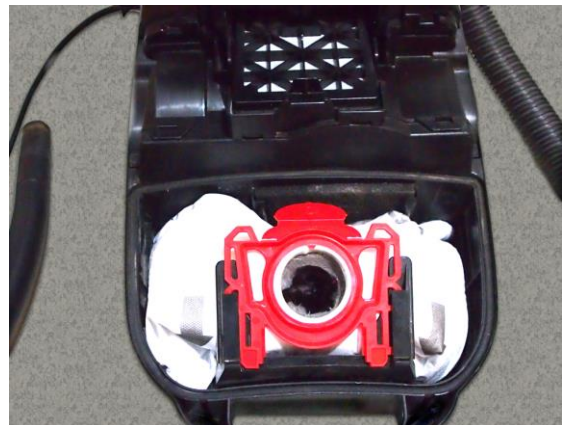
Staubsauger mit Beutel.