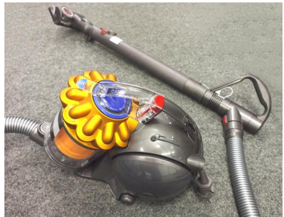
Staubsauger ohne Beutel.

Auch in Autos werden Filter eingesetzt, da bei der Verbrennung im Motor Schadstoffe entstehen und diese nicht über die Abgase in die Umwelt gelangen sollen.