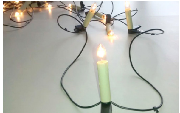
Abbildung 1: Lichterkette älterer Bauart.

Das Foto zeigt eine Lichterkette, wie man sie früher verwendet hat. Die Lampen sind hier in einer sogenannten Reihenschaltung zusammengebaut. Moderne Lichterketten sind dagegen häufig in Parallelschaltung zusammengebaut. Warum ist das so?