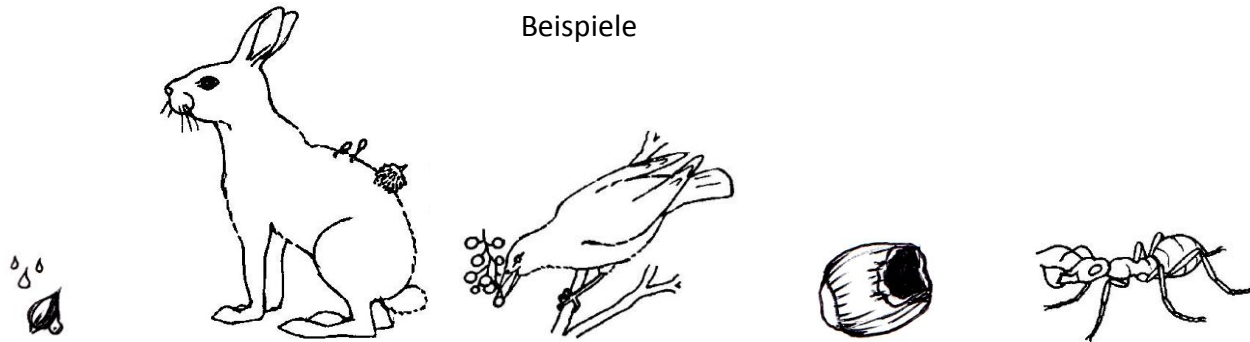
Abbildungen: F. KÖRNER