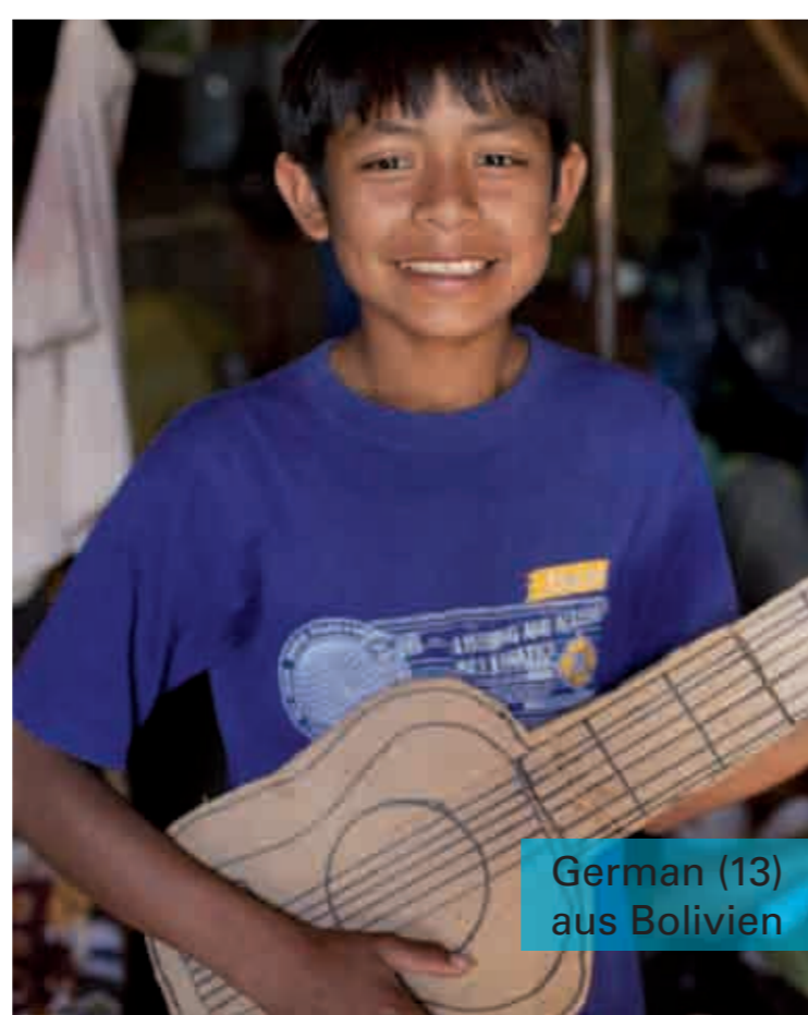
German (13) aus Bolivien