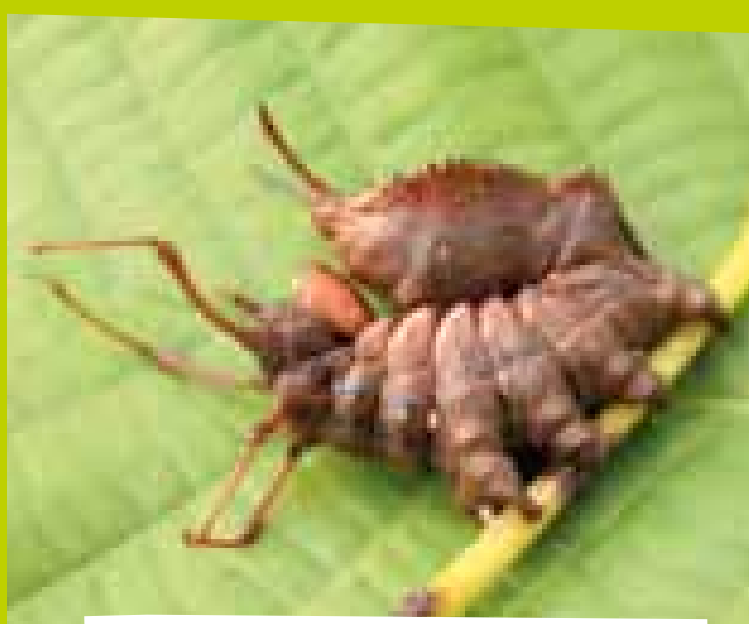
RAUPE DES BUCHEN-ZAHNSPINNERS IN SCHRECKSTELLUNG