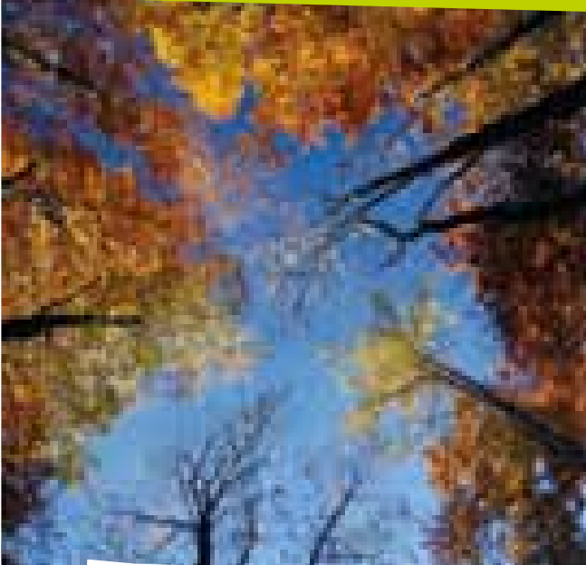
HERBST IM BUCHENWALD