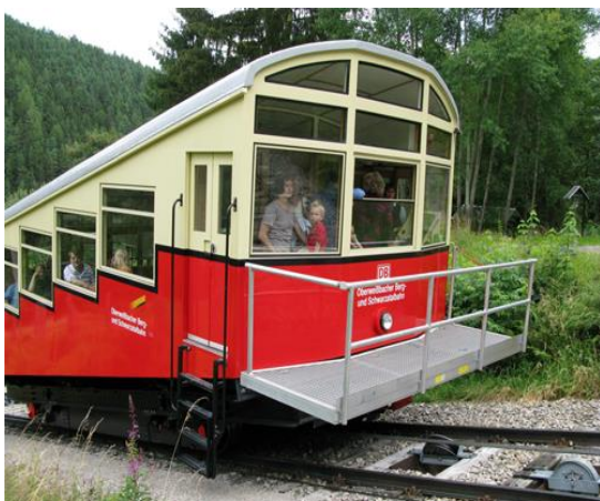
Oberweißbacher Bergbahn