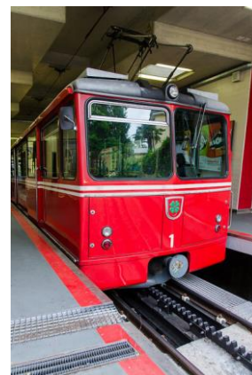
Dolderbahn, Fotograf: Shepard4711