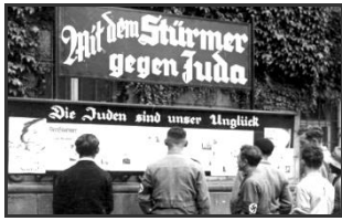
Nationalsozialismus / Zweiter Weltkrieg