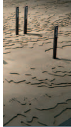
Modell der „KZ-Landschaft“ im Südharz

Die Seminarmodule können auf unterschiedliche Lernvoraussetzungen und Altersstufen zugeschnitten werden.