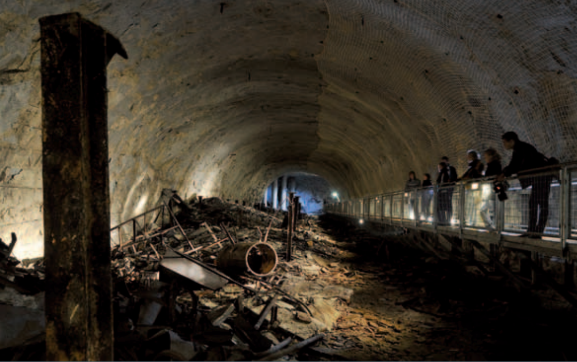
Querstellen im Kohnstein, 1943/44 als Unterkunft für KZ-Zwangsarbeiter genutzt

Zwangsarbeit war von Beginn an ein prägender Bestandteil der KZ-Haft. Zunächst als schikanöses Mittel der Bestrafung und „Erziehung“ eingesetzt, versuchte die SS schon bald, durch gnadenlose Ausbeutung finanzielle Gewinne zu erzielen. In der zweiten Kriegshälfte ging die SS dazu über, Häftlinge als Zwangsarbeiter an die Rüstungsindustrie zu verleihen. Die Häftlinge sollten helfen, die drohende Kriegsniederlage abzuwenden. Zwischen 1942 und 1945 entstanden etwa 1.000 KZ-Außenlager bei Industriebetrieben und Bauprojekten.