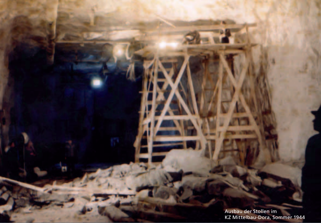
Ausbau der Stollen im KZ Mittelbau-Dora, Sommer 1944