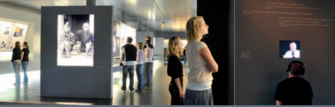
Dauerausstellung der KZ-Gedenkstätte Mittelbau-Dora