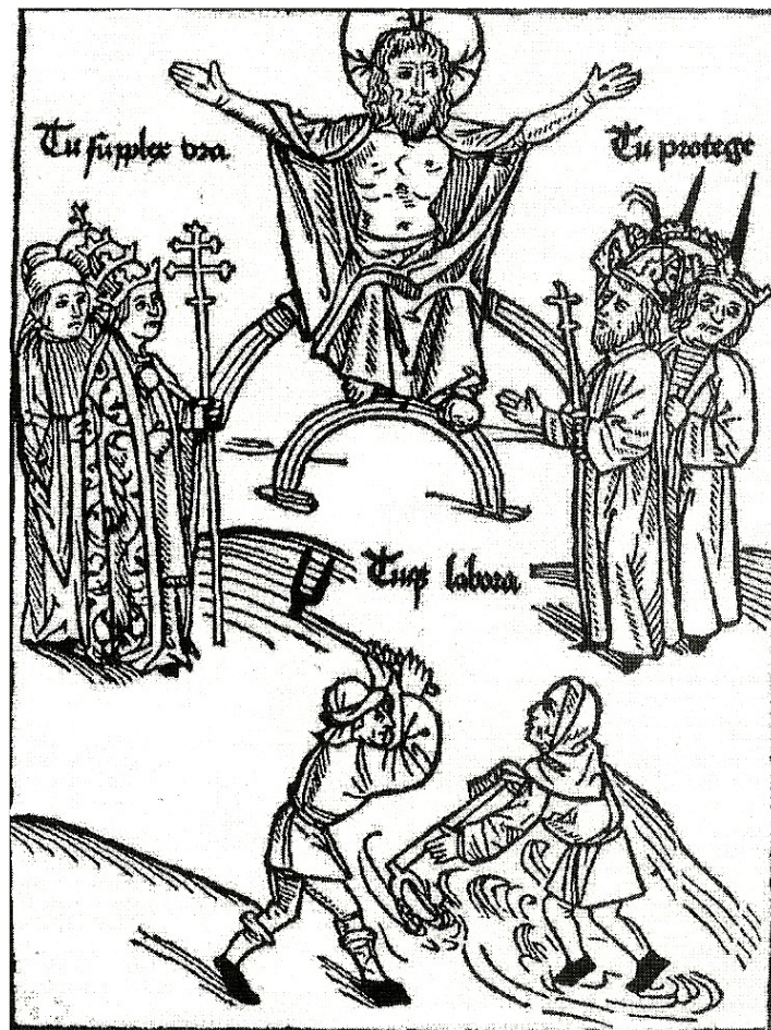
Abbildung Die Ständeordnung (1488, Johannes Lichtenberger)

Text oben links: Tu supplex ora : du bete demütig! Text oben rechts: Tu protege : du beschütze! Text unten mittig: Tu que labora : und du arbeite!