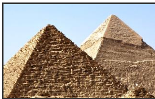
Erste Hochkulturen: Ägypten