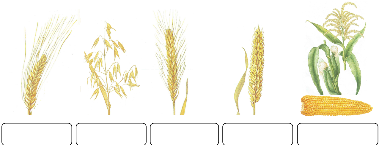
aus: Christiansen/Hanke, Gräser, 1988; aus: Volak/Stodola/Servera, Das große Buch der Heilpflanzen, 1983