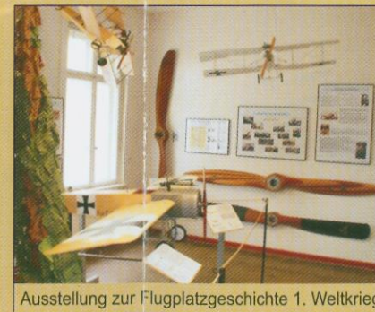
Ausstellung zur Flugplatzgeschichte 1. Weltkrieg