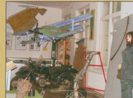
Ausstellung zur Sowjetischen Besatzungszeit