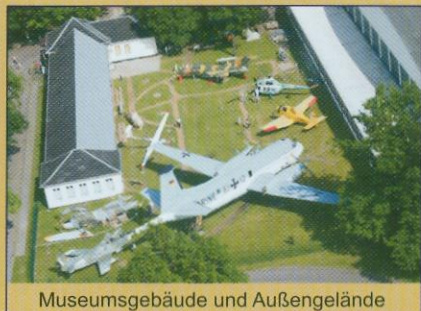
Museumsgebäude und Außengelände