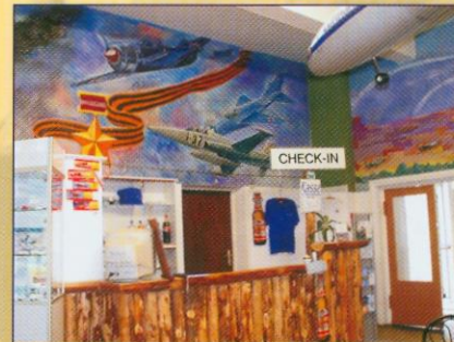
Empfang und Café mit historischen Wandgemälden