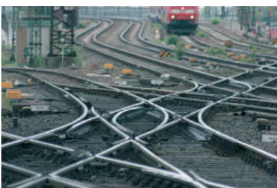
Bedarfsgerechte Instandhaltung für wartungsintensive Infrastrukturelemente

ETCS set up common standards for the rail traffic in Europe