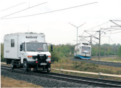
Versuchs- und Messfahrzeug RailDrIVE®