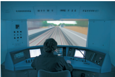
Interaktive Systeme im Bahnlabor RailSiTe®

Eine optimal an die menschlichen Fähigkeiten angepasste Mensch-Maschine-Schnittstelle beugt Fehlbedienungen und daraus entstehenden Kosten vor. Das DLR unterstützt Hersteller und Betreiber bei der Entwicklung gebrauchstauglicher interaktiver Systeme und der Überprüfung der Usability von bereits existierenden Systemen im Bahnbereich. Gestaltungsempfehlungen werden abgeleitet und prototypisch umgesetzt und validiert.