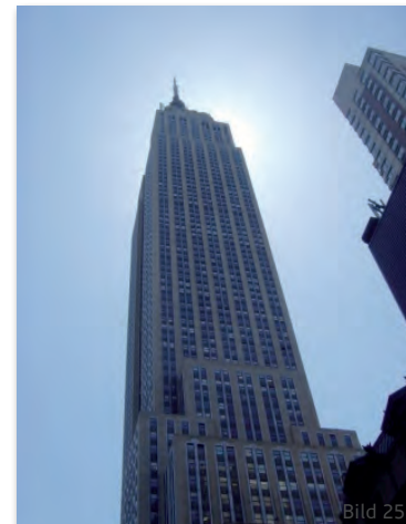
Empire State Building