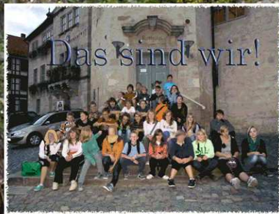
Das sind wir!

Dort erlebten wir eine anstrengende, aber auch abenteuerliche Zeit mit Wandern, Klettern, Abseilen und Floß bauen. Hier einige Eindrücke!