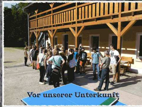
Vor unserer Unterkunft

Wir, die Schüler der 7a/b waren vom 17.09. -21.09.2012 in Blankenburg/Harz. Unterkunft fanden wir im Naturfreundehaus.